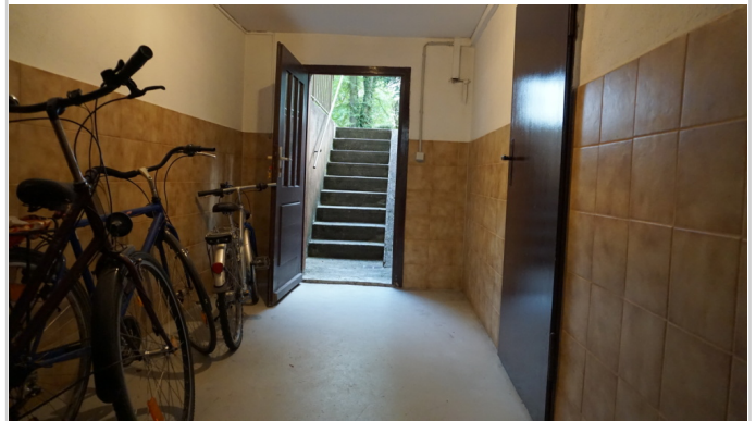
Ausgang zu Garten